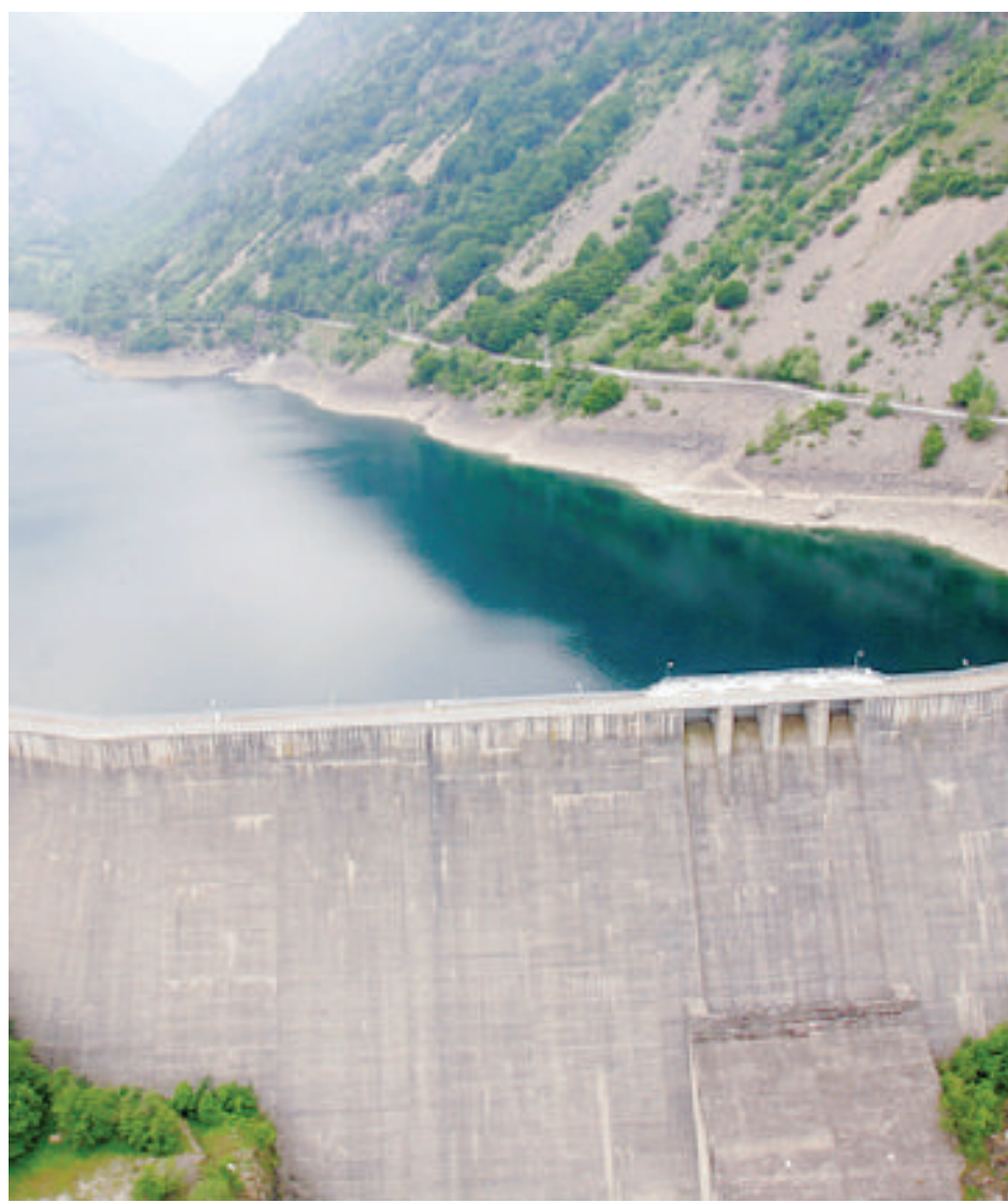
L'invaso della Piastra. In alta Valle Gesso, può contenere 12 milioni di metri cubi d'acqua

Manifestazioni Uncem ai piedi delle dighe e a Roma