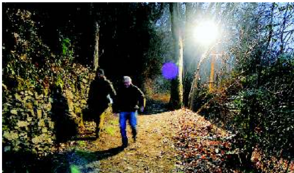
170 abitanti delle frazioni isolate dalla frana sono costretti a servirsi dell'antica mulattiera

La notizia del finanziamento, che permetterà di