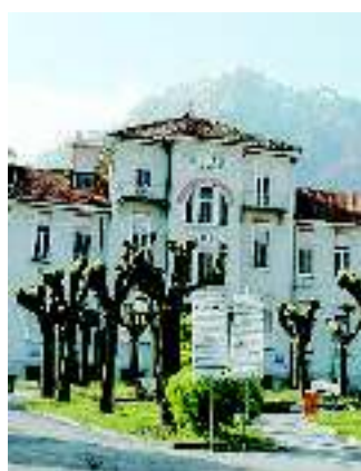
L'ala vecchia del «San Biagio»

La generosità di un uomo, morto a 73 anni per emorragia cerebrale, e dei suoi familiari che hanno consentito la donazione degli organi, darà speranza a chi è in attesa di un trapianto. L'espianto multiorgano è avvenuto la settimana scorsa, all'ospedale San Biagio di Domodossola, a cura del Centro di riferimento regionale di Torino che è intervenuto con una propria squadra dopo aver avviato le procedure per il reperimento dei potenziali riceventi sul territorio nazionale. Il fegato è stato prelevato