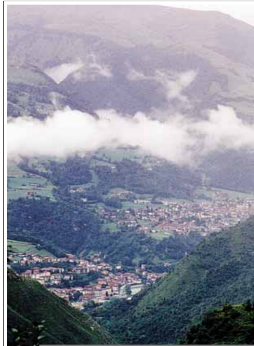
Valle Seriana, la comunità montana è la più popolosa della Lombardia