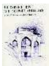
TITOLO: LE CARTE DI RISO. QUINDICI POETI VERCELLI A CURA DI: FRANCESCA TINI BRUNOZZI EDITORE: TORINO POESIA

Il volume si inserisce in una collana della Priuli&Verluccha che con metodo porta al grande pubblico le opere di «Fotografi della montagna».