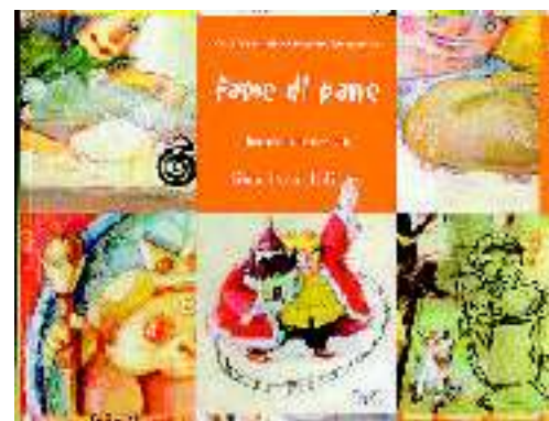
TITOLO: FAME DI PANE AUTORI: GIUSI QUARENCHI E ALESSANDRA MASTRANGELO ILLUSTRAZIONI: DANIELA VILLA EDITORE: SLOW FOOD PREZZO: 14 EURO

Guarda, tocca, annusa, assaggia. Quindi valgono forma, dimensioni, colore e aspetto della crosta, colore della mollica. Ma anche il profumo, la consistenza in rapporto con la possibilità di lanciarsi sulle sensazioni gustative legate a legna, olio, erbe aromatiche, burro, strutto, spezie, latte o cereali. Di che si tratta? Ma del pane. L'invito ad andare oltre al semplice «mangiare» è di Slow Food che ad un bel volume illustrato che ne svela