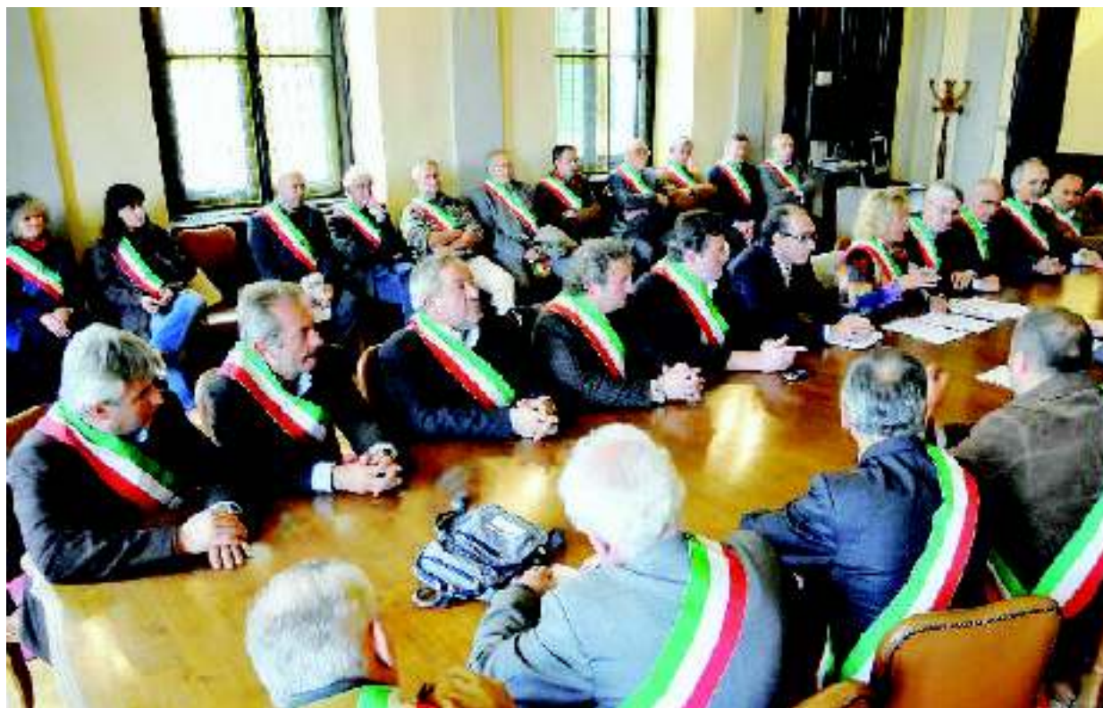
Sindaci di comuni di montagna un anno fa in Prefettura a Cuneo: la riunione era stata indetta «in difesa delle Comunità montane»