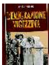
TITOLO: L'EMIGRAZIONE VIGEZINA AUTORE: ANITA AZZARI EDITORE: IL ROSSO E IL BLU

Anita Azzari nel 1950 si laureò con una tesi sull'emigrazione Vigezzina. Era la prima monografia del dopoguerra sul tema e venne data alle stampe in 500 copie nel 1951. Viene riproposta con un interessante corredo di nuove immagini.