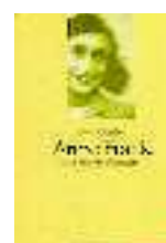
TITOLO: ANNE FRANK. UN RACCONTO DOCUMENTO EDITORE: PAGINE DISPERSE AUTORE: ERNST SCHNABEL

«Pagine disperse» è la collana che propone volumi altrimenti introvabili. Quello di Ernst Schnabel è il racconto-documento degli incontri e le testimonianze di 42 personaggi citati nel diario di Anne Frank. Contattati, incontrati, intervistati.