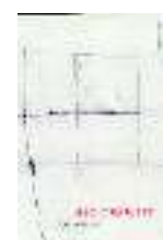
TITOLO: SIC TRANSIT AUTORE: LUCA ARNAUDO EDITORE: NEROSUBIANCO

Suggestioni, invenzioni, sogni, accelerazioni del pensiero. Flash. Difficile sintetizzare il libro che lo stesso editore definisce «ondivago e divagante, composto di elementi narrativi che sorprendono con invenzioni continue all'apparenza sconnesse, in realtà collegate».