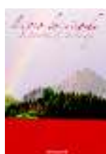
TITOLO: L'ECO DEI RICORDI AUTORI: VARI EDITORE: NEROSUBIANCO

Gli anni oscillano tra il 1920 e il '70. La frazione è Santa Lucia di Monterosso (Cuneo). Mini comunità, unica ma simile a mille altre sulle Alpi. I ragazzi di allora ricordano, ricostruiscono, raccontano. Piccoli gesti, consuetudini, emozioni non ripetibili.