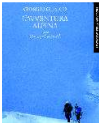
TITOLO: L'AVVENTURA ALPINA FOTO: GIORGIO GUALCO TESTO: GIUSEPPE GARIMOLDI EDITORE: PRIULI&VERLUCCA

Un omaggio al fotografo savonese Giorgio Gualco (1929-1997). Libro-memoria dedicato a un maestro della fotografia, capace di immortalare luci, contrasti, armonie. Tema unico la montagna. Co-editore il Club Alpino italiano che ha affidato a Giuseppe Garimoldi il testo che accompagna immagini straordinarie, dove il bianco e nero offre le emozioni che solo i grandi artisti sanno regalare. Quello proposto è un viaggio nell'inverno alpino: cime, tracce di animali, sci alpinismo, creature del ghiaccio.