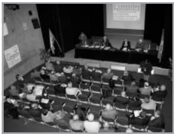
Un momento del congresso al Teatro Galletti