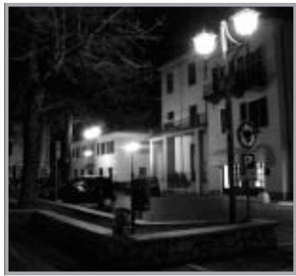
Il luogo dove la scorsa notte l'uomo accoltellato ha cercato soccorso