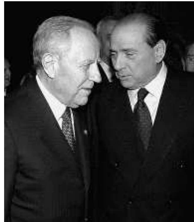
Nuove tensioni tra Carlo Azeglio Ciampi e Silvio Berlusconi

uno stop. Ma nonostante l'alzata di scudi dei due partiti, il fondo si attesta su un miliardo. E' anche probabile a questo punto che i provvedimenti a favore della famiglia vengano inseriti nel maxiandamento che il governo sta preparando come sintesi di tutti i punti politici determinanti. Tra questi provvedimenti è ormai quasi certo il bonus per il secondo figlio di 1000 euro per i nati sia nel 2005 che nel 2006. Per coprire le esigenze dei nati del 2005 e 2006 servirebbero circa 600 milioni per due anni. Si è discusso anche di altre misure come il sostegno per tutti coloro che mandano i propri figli nelle scuole private.